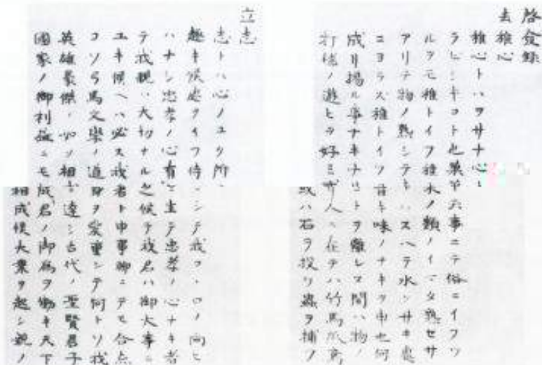
※「啓發録」原本の一部。「少年、君たちはどう生きるか」から転写

「啓發録」は、橋本左内先生が15歳の時に、自分自身の生き方の心構えを書き表したもので、 「雅心を去る」をはじめ、五項目からなる、和綴じ19丁(38頁)に及ぶものです。 私たちは、郷土が生んだ左内先生の精神を誇りをもって学ぶと共に、 これらの心構えを現在の私たちの生活に役立てていきたいものです。