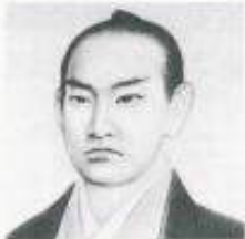
はしもじうない 橋本左内先生 略歴

1834年(天保5年)福井城下常盤町(現福井市春山)に生まれ、1848年(嘉永元年)には、15歳で啓發録をあらわす。その後蘭学をはじめヨーロッパの学問を修め、さらに儒教や日本の学問についても懸命に勉強し、世界の中の日本のあり方を常に考え、福井・江戸で活躍するも、1859年(安政6年)安政の大獄で吉田松陰らとともに刑死(26歳)。