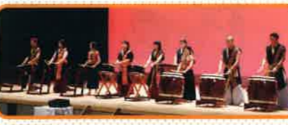
●「活動発表 大飯ブレイズ」● 世代を超えて地域を盛り上げる力強い太鼓を披露してくださいました。