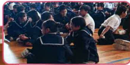
ー子ども達で話し合うー