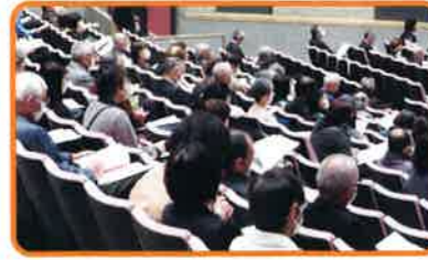
ご参加ありがとうございました 参加者：青少年育成関係者・保護者など約250名