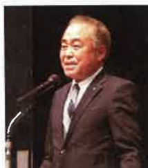
閉会のあいさつ 室永平寺町民会議副会長 (永平寺町教育長)