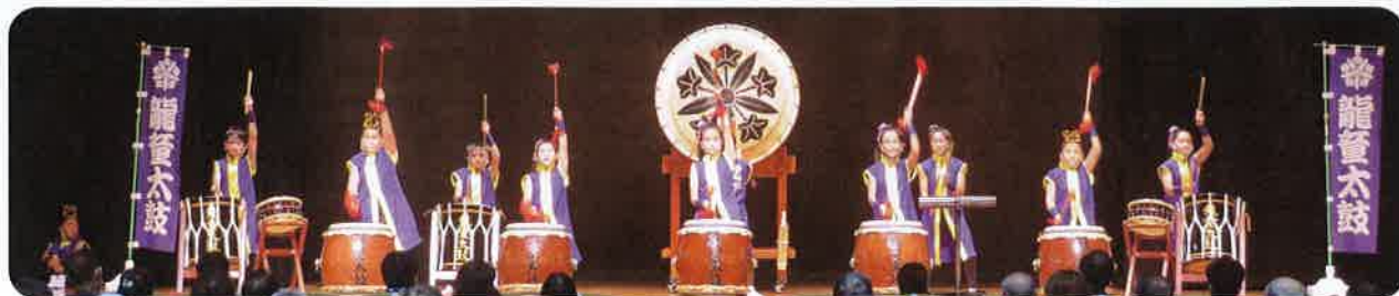
えいへいじりんどうたいこ 永平寺龍童太鼓 のみなさん