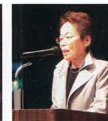
田村県民会議会長