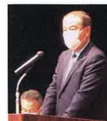
来賓の宮本福井県議会 副議長