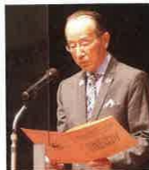
大会宣言 光野福井市民会議副会長