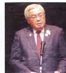
来賓の東村福井市長