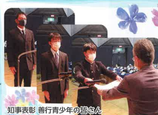
知事表彰 善行青少年の皆さん