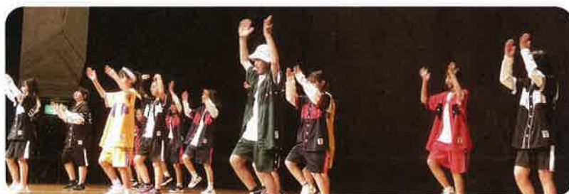
わだ ヒップホップ WADA HIPHOP のみなさん(福井市)