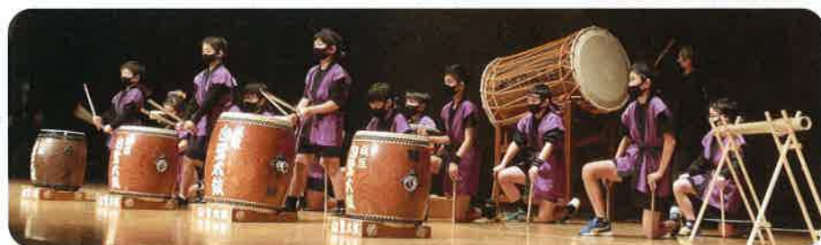
いたがきしらさぎだいこ 板垣白鷺太鼓 のみなさん(福井市)

多様な人と交流し、体験する地域での活動は、自身が社会の一員であることを自覚するなど、青少年の健やかな成長に良い影響を与えます。また、地域全体に活気を与えてくれます。