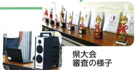
県大会 審査の様子